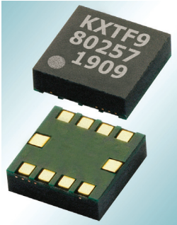
A Kionix KXTF9 gyorsulásmérő

Implementált algoritmusok segítségével akár egytucatsnyi egyedi, érintésre aktiválódó parancsra betanítható.